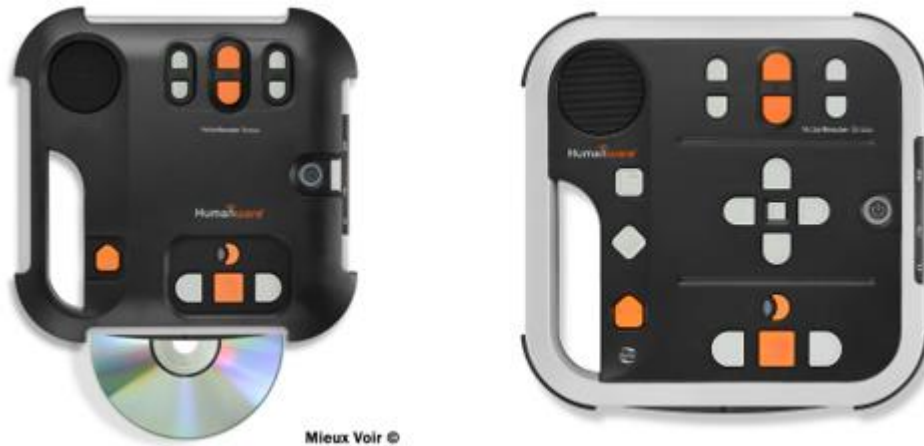
Victor Reader Status M avec ou sans guide doigts

dans la structure du livre (chapitres, pages, pose de signets...). Cette possibilité est offerte sur les livres respectant le format Daisy reconnu par des lecteurs adaptés, comme l'excellent Victor Reader Stratus, conseillé par l'AVH et dont de nombreuses médiathèques ont fait l'acquisition. Cet appareil, connu de longue date des personnes mal voyantes, apporte un excellent compromis pour être accessible à un large public (personnes mal ou non voyantes, personnes présentant un handicap moteur, seniors...).