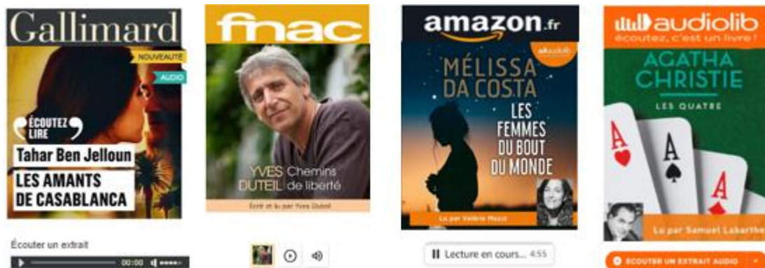
Exemples de livres audio du commerce

Gallimard : collection « Ecoutez Lire » : https://www.ecoutezlire.fr